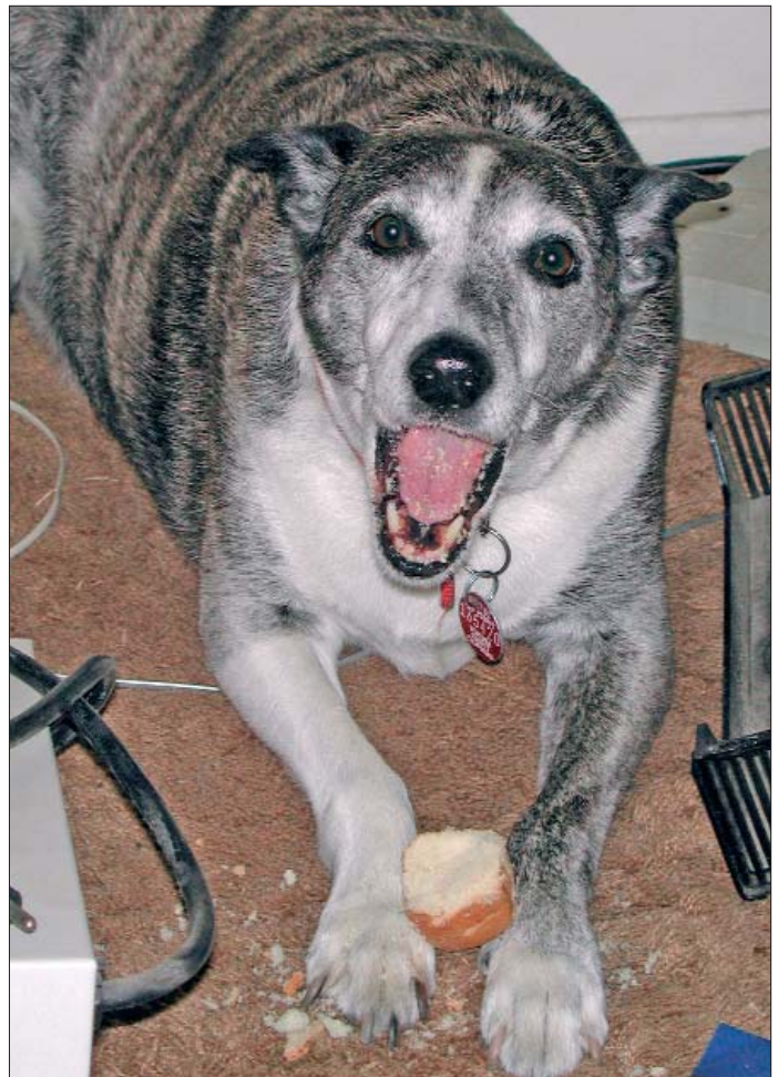
Nach der neuen Grazer Studie geschahen 4% der Beißverletzungen von Kindern durch die Störung eines Hundes beim Fressen.

siebte DSH, während von 1643 Mischlingen „nur“ 39 durch eine Beißverletzung auffällig geworden sind. Den zweitgrößten Risiko-Index hat der Dobermann (2,71) mit allerdings nur 65 Exemplaren (1,1% der Hundepopulation), von denen 8 durch eine Beißattacke auffällig wurden. Die dann folgenden Rassen stehen in ihrer Beißfrequenz in deutlichem Abstand zu DSH und Dobermann. An dritter Stelle steht – unerwartet – der Spitz, gefolgt von Pekingesen, Dackeln, Schnauzern und Collies. Das Ergebnis dieser Studie steht in Einklang mit weiteren 10 Studien zwischen 1991 und 2004, wobei in sieben dieser Studien stets der DSH die häufigsten Beißverletzungen verursachte.